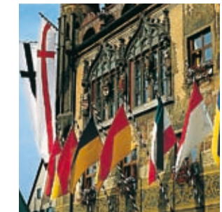
Festbeflaggung am Schwörmontag.

Aus den Fenstern hängen dann die Wappentücher der Ulmer Patrizier- und Kaufmannsfamilien, und zahlreiche Fahnen erinnern an die Ulmer Geschichte, die seit Jahrhunderten von dieser Stelle aus gestaltet wird.