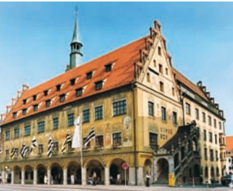
Nordwestseite mit Treppengiebel.

dass die Wahl des Kaisers durch sieben Kurfürsten zu erfolgen hatte, wurde es Mode in vielen deutschen Städten, die Rathäuser mit den steinernen Figuren dieser Kurfürsten und des Kaisers zu verzieren. Dafür entschieden sich auch die Ulmer, als sie um 1420 die südöstliche Partie ihres Rathauses im ersten Obergeschoss mit repräsentativen Prunkfenstern versahen. Die gehörten zum neuen großen Ratssaal, der über der dreischiffigen Kaufhalle eingezogen wurde. Diese vergrößerte Tagungsstätte wiederum war notwendig geworden, nachdem der Rat infolge der Verfassung des Großen Schwörbriefs von 32 auf 72 Mitglieder angewachsen war.