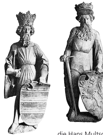
Die Könige von Ungarn und Böhmen von Hans Multscher am Ostfenster.

die ihm aber bis 1436 die Anerkennung versagten. Der König von Böhmen wiederum war einer der sieben Kurfürsten. Diese Situation erklärt die Figuren an der Ostfassade: links steht der König von Ungarn (Sigismund), rechts der siebente und letzte Kurfürst, der König von Böhmen (ebenfalls Sigismund) und in der Mitte Karl der Große, mit dem sich Sigismund als Kaiser in spe ebenfalls identifizieren konnte. Er dürfte mit hin die Rathaus-Ostfenster,