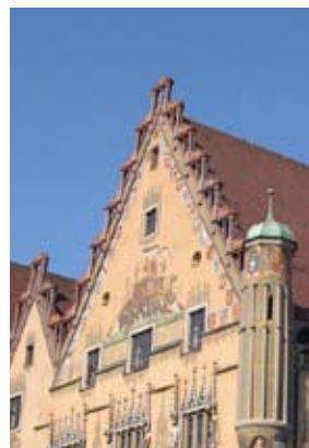
Gemälde der Ulmer Schachtel am Südgiebel.

Die Szenen an der Rathauswand dürfen jedoch nicht als Ulmer Eigenleistung verbucht werden. Vielmehr stammen die Texte zum Teil wörtlich aus zwei damals in Augsburg gedruckten Büchern, in denen der fränkische Adelige Johannes von Schwarzenberg Ciceros Schrift „De officiis“ sowie biblische Themen in Reimform aufbereitete und mit zahlreichen