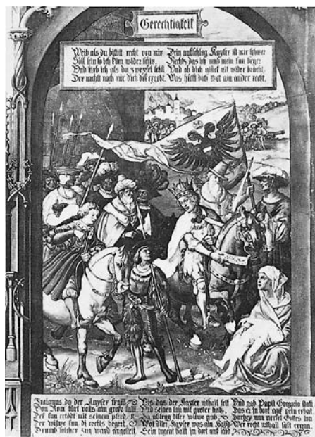
Wandgemälde an der Ostfassade „Gerechtigkeit“.

Zwar weichen diese beiden kurzen Texte mit den dazugehörigen schmalen Illustrationen im Umfang von den übrigen Fresken ab, doch sie vermitteln einen Eindruck von der Absicht, die der Ulmer Rat mit der Fassadengestaltung seines Domizils verfolgte: Die bunten Bilder und die dazugehörigen Reime sollten die Betrachter zur geflissentlichen Nachahmung ermuntern. So geriet das Ulmer Rathaus zu einem erbaulichen Bilderbogen, dessen Ostseite unter den Stichwörtern „Göttliche Weisheit“, „Selbsterkenntnis“, „Gerechtigkeit“, „Geduld“, „Liebe“, „Hoffnung“, „Glaube“, „heimlicher Neid“ und „kindischer Rat“