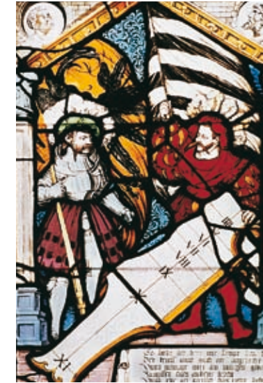
Glassonnenuhr im kleinen Ratssaal.

Eine kleine Kostbarkeit hat in einem der östlichen Ratsfenster die Jahrhunderte überlebt: eine Glassonnenuhr. Sie kann jedoch nur die vormittäglichen Stunden zeigen, was insofern egal war, als der Ulmer Rat zur Reichsstadtzeit nur vormittags tagte. Der Zeitanzeiger konnte jedoch nicht verhindern, dass die Sitzungen viel zu lange dauerten, wie wir aus zahlreichen diesbezüglichen schriftlichen Ermahnungen wissen. Am prächtigsten präsentiert sich das Ulmer Rathaus in der Woche vor dem Schwörmontag, den die Stadt am zweitletzten Montag im Juli feiert.