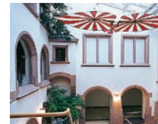
Der Lichthof mit Berblinger Flugapparat.

Das Innere des Rathauses ist im Bombenhagel des 17. Dezember 1944 weitgehend zerstört worden. Es wurde Ende der 80er Jahre noch einmal gründlich umgebaut, und seither hängt im Lichthof eine Nachbildung des Hänggleiters von Albrecht Ludwig Berblinger. So hieß der „Schneider von Ulm“, der 1811 mit seinem durchaus flugtauglichen Gerät aufgrund ungünstiger Thermik unsanft in der Donau landete.