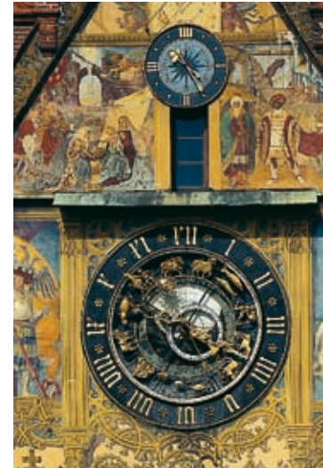
Die astronomische Uhr am Ostgiebel.

Alle finden sie wunderschön, aber kaum einer versteht sie: die astronomische Uhr im Ostgiebel. So sehr ihre vier Zeiger und zahlreichen weiteren Elemente verwirren, folgen sie doch einem recht einfachen Prinzip: Der Betrachter steht in der Mitte des Zifferblattes und wird umkreist von der Sonne, dem Mond und den Tierkreiszeichen. Steht die Sonne oben, ist Mittag. Doch würde es hier zu weit